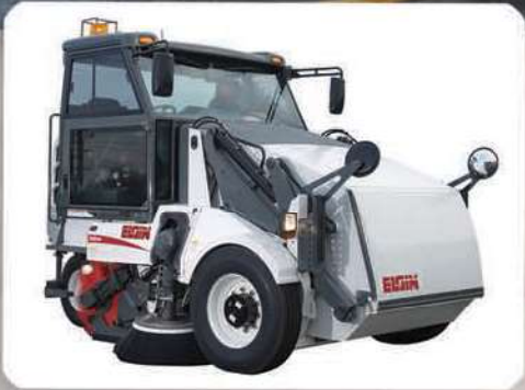
Modelo S — Mecánico