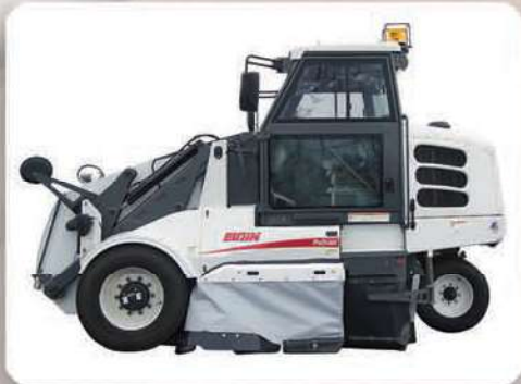
Modelo PW — Hidráulico sin agua