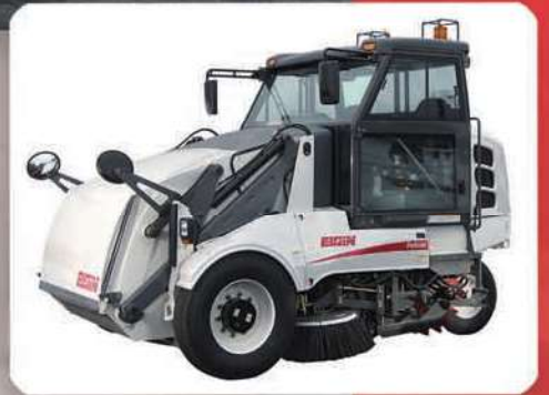
Modelo P — Hidráulico